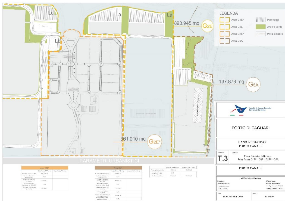
Figura 5. T.3 Piano Attuativo Porto Canale, particolare