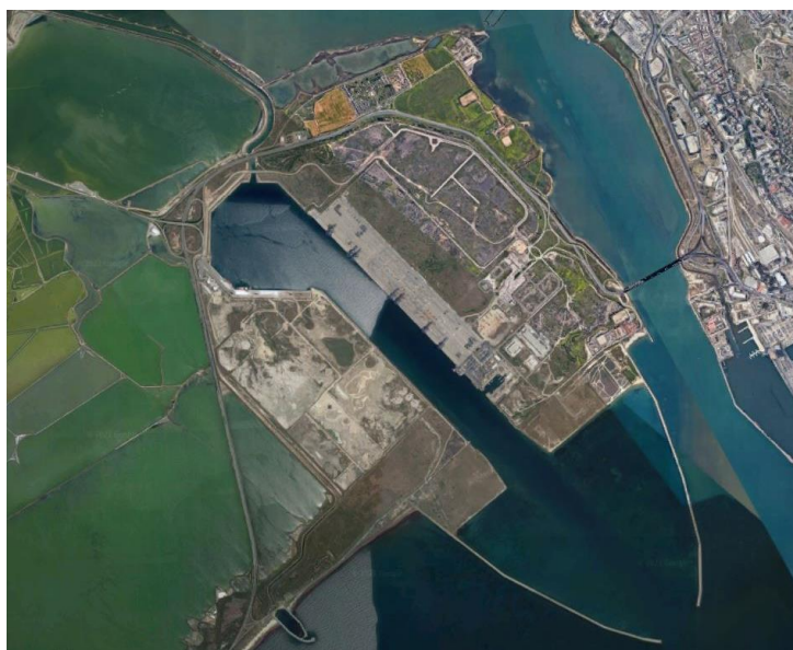
Figura 1. Porto Canale di Cagliari