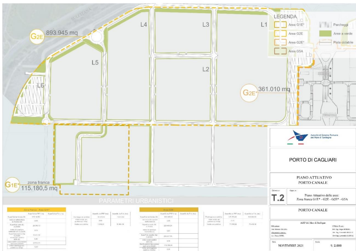
Figura 4. T.2 Piano Attuativo Porto Canale, particolare

Segue la rappresentazione tramite gli elaborati grafici: