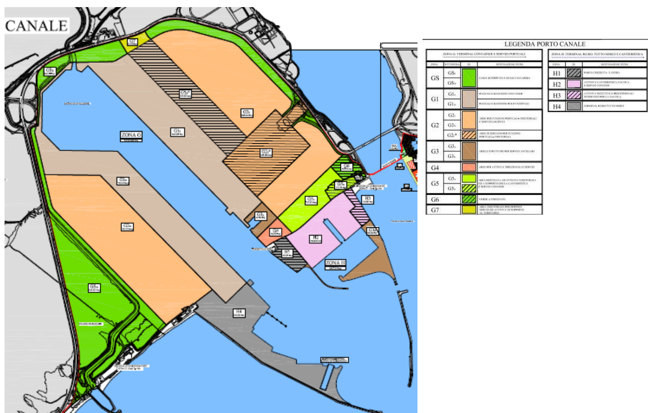
Figura 2. Tavola di PRP del Porto Canale di Cagliari e sottozone